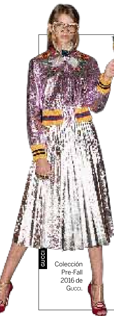
GUCCI Colección Pre-Fall 2016 de Gucci.