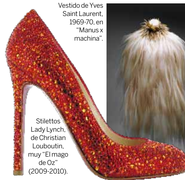
Vestido de Yves Saint Laurent, 1969-70, en "Manus x machina".