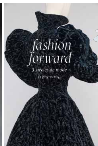
Cartel de la exposición "Fashion Forward", en París.