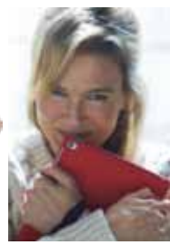
Renée Zellweger en "Bridget Jones" y Helena Bonham Carter en "Alicia".

Batirán récords los films inspirados en cómics, como "Batman v Superman" (marzo), "Deadpool" (febrero) o "X-Men: Apocalipsis" (mayo); los basados en bestsellers, como "La quinta ola" (en cartelera, la trilogía que sucederá a "Los juegos del hambre") o, en otoño, "La chica del tren", "Inferno" y "Un monstruo viene a verme"; los firmados por grandes nombres, como Tarantino y "Los odiosos ocho" (en cartelera)... y, claro, el primer spin off de "Star Wars", "Rogue One" (diciembre).