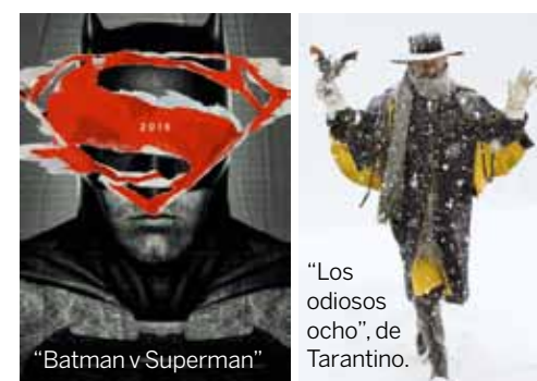
"Batman v Superman"

Querrás reunirte de nuevo con algunos de tus personajes favoritos: la encantadora Alicia ("Alicia a través del espejo", mayo); la caótica, y ahora madre, Bridget Jones ("Bridget Jones' Baby", 16 de septiembre); el duro de Bourne (en julio y otra vez con Matt Damon); el incansable Rocky, que llega con buenísimas críticas ("Creed. La leyenda de Rocky", 5 de febrero) o el simpático Nemo ("Buscando a Dory", junio). Secuelas que ya huelen a triunfo.