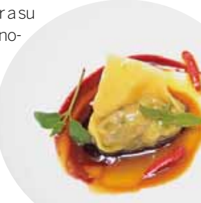
Cocina manchega actualizada en Restaurante Adolfo.

Según el ranking de mejores destinos 2016 de Lonely Planet, Botsuana es el mejor país; Kotor (Montenegro), la mejor ciudad y Transilvania (Rumanía), la mejor región por descubrir. El desconocido país africano alberga fascinantes paisajes vírgenes como el delta del Okavango, donde podrás alojarte en campamentos perfectos para hacer safaris, como el Mombo Camp ; pide más información en la agencia Nuba ( nuba.net ). Los sibaritas no deben faltar a su cita con Toledo , Capital Española de la Gastronomía 2016. No dudes en reservar en el emblemático Restaurante Adolfo ( grupoadolfo.com ) y probar su perdiz roja en dos texturas. Otro destino: Roma , que ya luce su Coliseum y Fontana de Trevi restaurados, con la nueva colección de Dolce & Gabbana en tu maleta.