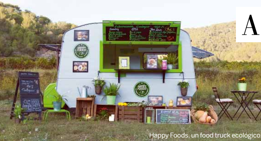
Happy Foods, un food truck ecológico.