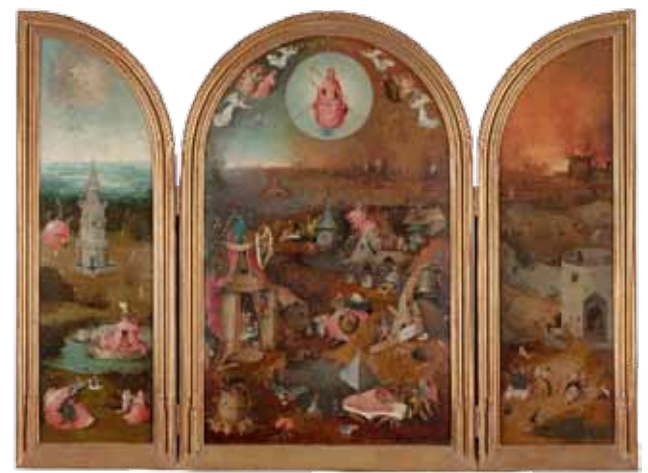
"El juicio final", de El Bosco (ca. 1495-1505).