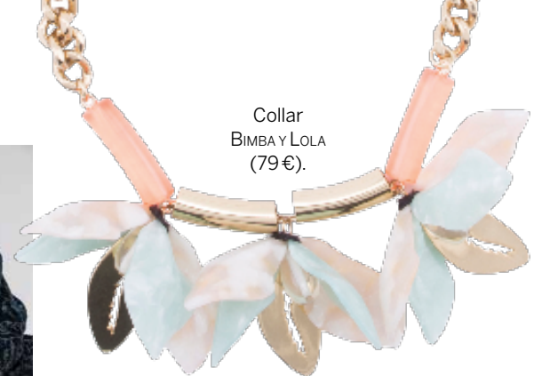
Collar BIMBA Y LOLA (79€).

Los colores del año, por esta vez, son dos: rosa cuarzo y azul serenity. Palabra de Pántone.