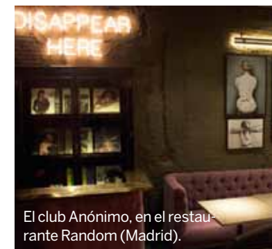
El club Anónimo, en el restaurante Random (Madrid).