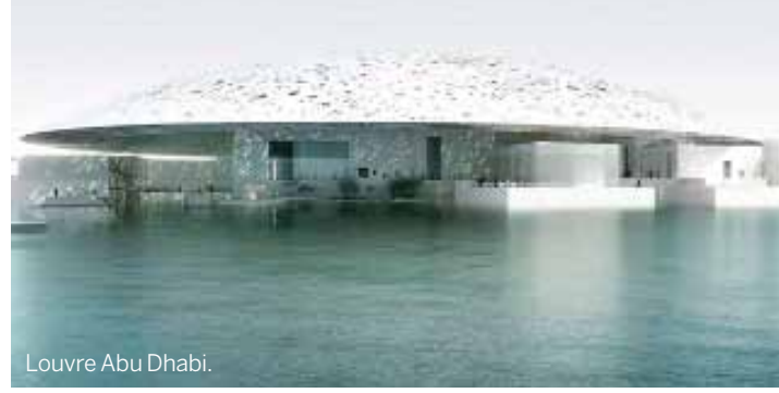
Louvre Abu Dhabi.