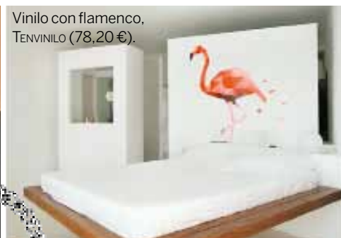
Vinilo con flamenco, TENVINILO (78,20€).