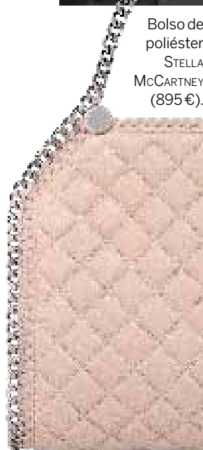
Bolso de poliéster STELLA McCARTNEY (895€).

El movimiento por el derecho de los animales y contra su maltrato gana cada vez más adeptos: numerosos creadores, como Stella McCartney , han renunciado a utilizar pieles en sus diseños –ella opta por versiones sintéticas o "faux fur" y por materiales reciclados (el bolso de la izquierda está elaborado, por ejemplo, con botellas de plástico)– y las novedades literarias apuestan alto por los libros sobre animales. Así, la nueva y conmovedora novela de Alejandro Palomas, "Un perro" (Destino, 18,90€), retrata la relación entre el autor y su mascota; la excusa para un homenaje al amor y a la familia. En marzo se publicará "Un animal es una persona", de Franz-Olivier Giesbert (16,90€), que nos hace reflexionar con su defensa animal, nada integrista y muy inteligente y humorística. Dos estrenos de cine que gustarán a los animalistas: "Zootrópolis" (estreno: 12 de febrero) y "Mascotas" (prevista en agosto).