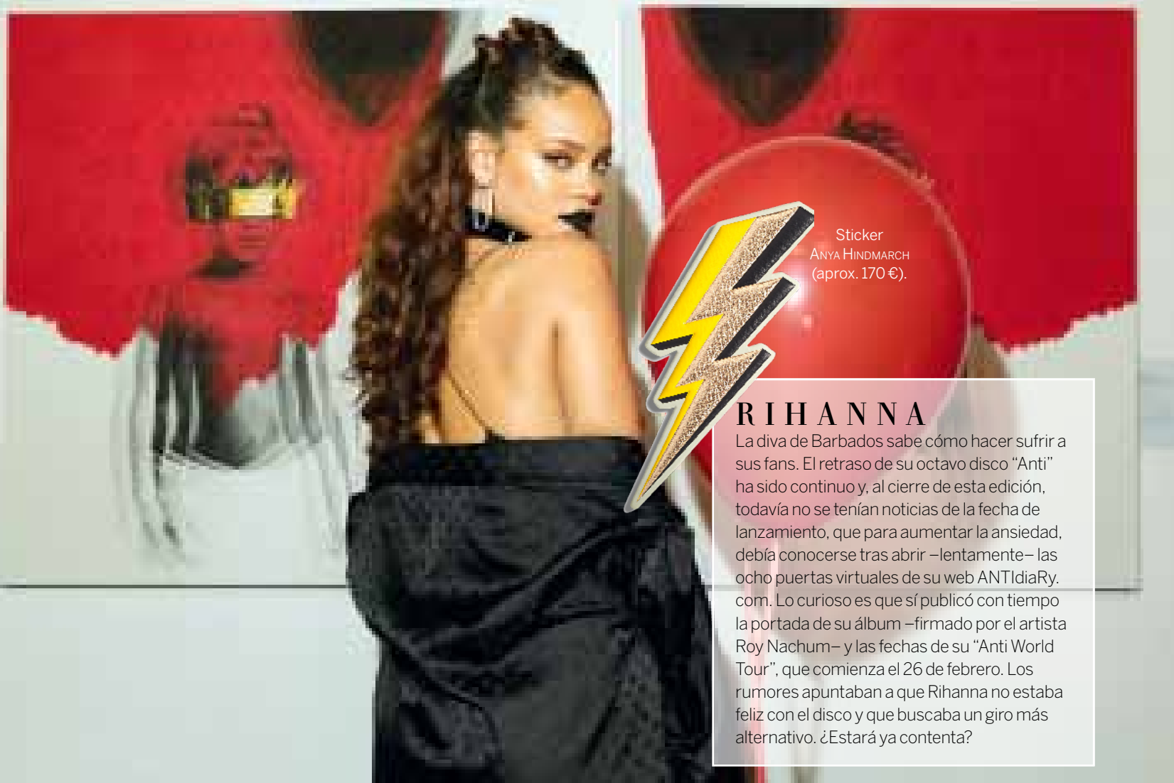
Sticker ANYA HINDMARCH (aprox. 170 €).