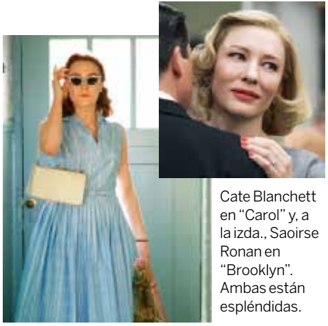
Cate Blanchett en "Carol" y, a la izda., Saoirse Ronan en "Brooklyn". Ambas están espléndidas.

Dos estrenos con excelentes críticas y un cuidado estilismo ambientado en los 50 llegan este mes: "Carol" (5 de febrero), el film de Todd Haynes sobre la relación lesbiana de una mujer casada con una fotógrafa (Cate Blanchett y Rooney Mara); y "Brooklyn" (26 de febrero), un drama sobre la inmigración con Saoirse Ronan.